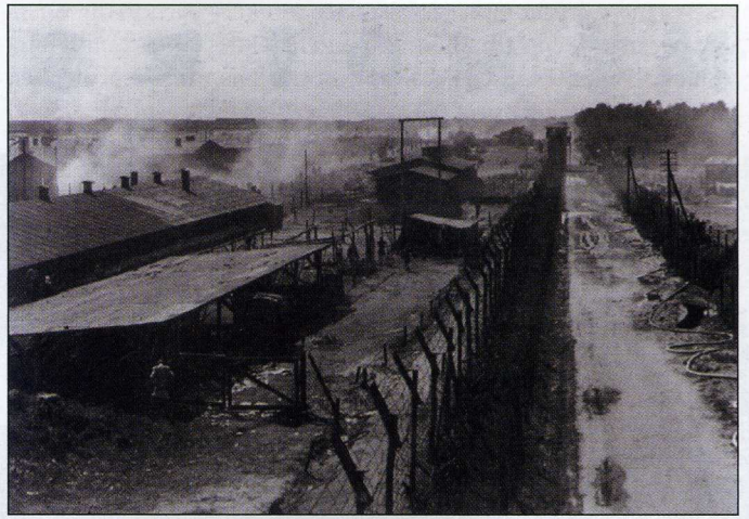
Vue du camp depuis un des miradors.

En février 1943, le Ministère des Affaires étrangères du Reich conçoit un plan selon lequel environ 30 000 détenus juifs pourraient servir d'otages en vue d'un éventuel échange. Himmler lui-même réclame un contingent de 1600 Juifs ayant de la famille en Palestine.